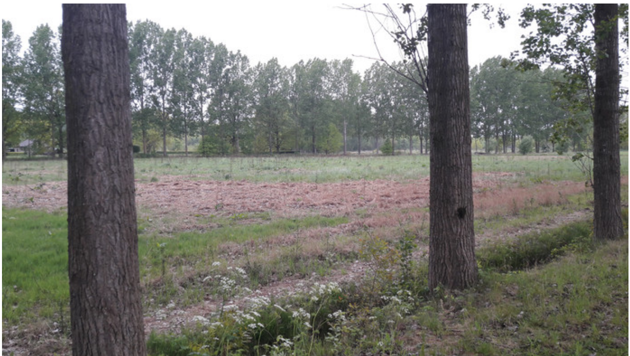
Het voedselbos bij Hardekamp bestaat nu nog alleen uit kleine planten en andere gewassen.