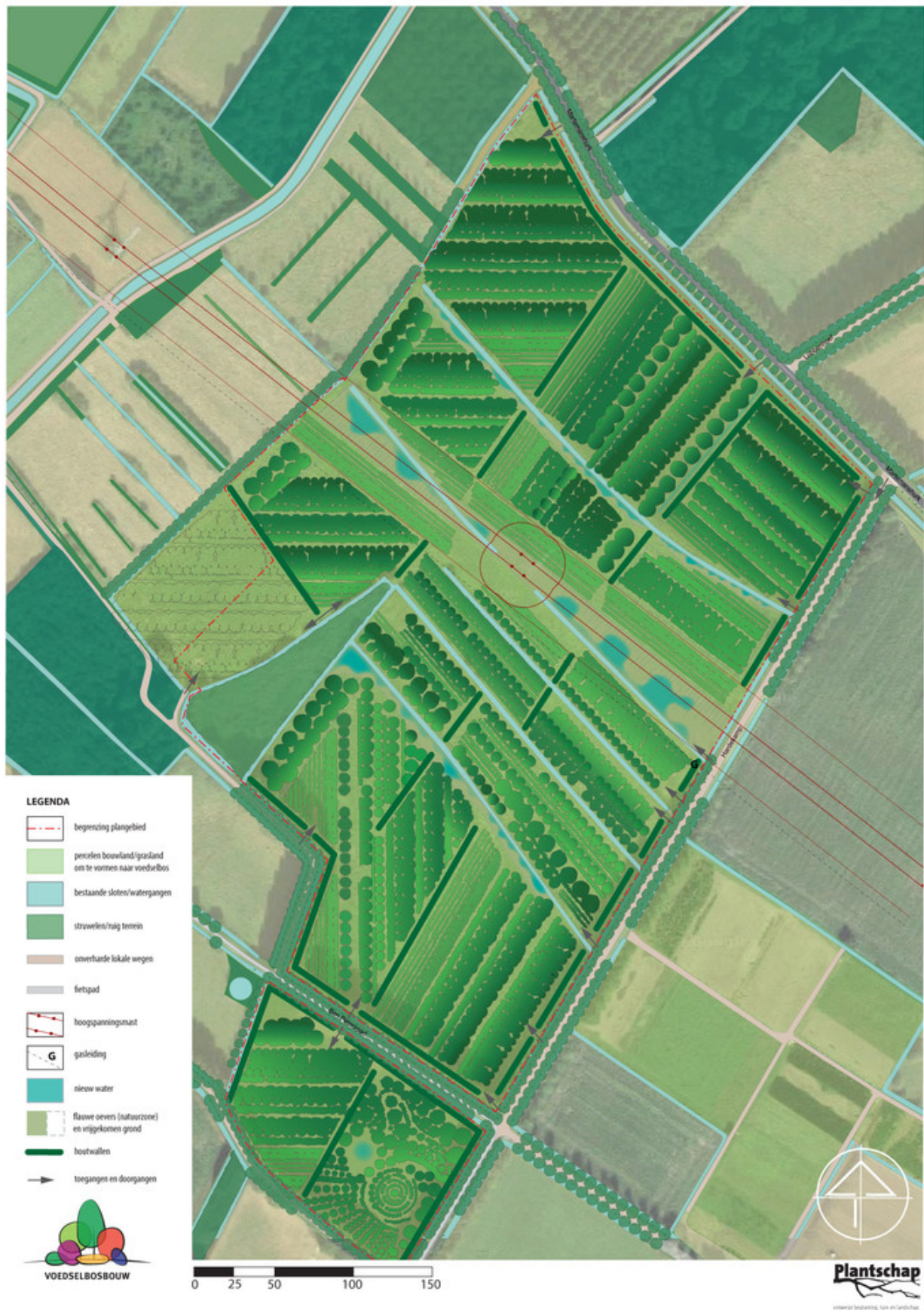
Aan Hardekamp in Schijndel ligt zestien hectare voedselbos.

Wouter van Eck staat niet te kijken van de argwaan. „Ik vind de